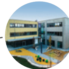
Realschule Dußlingen → 2019