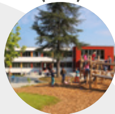
Schulgebäude In Laisen → 2013