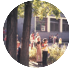
FES im Bea-Haus → 1974