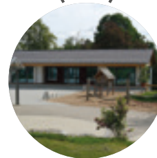
Haus der Begegnung → 2016