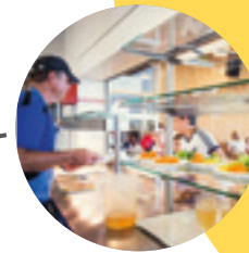
Start Mensabetrieb → 2006