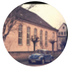
Schulstart im Gemeindehaus Betzingen → 1973