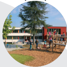
Schulgebäude in Laisen → 2013