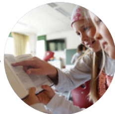
Neues Leitbild → 2016