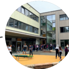
Realschule Dußlingen → 2019