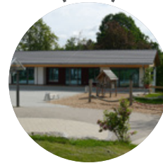
Haus der Begegnung → 2016