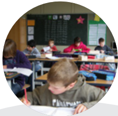
Gründung Realschule → 2009