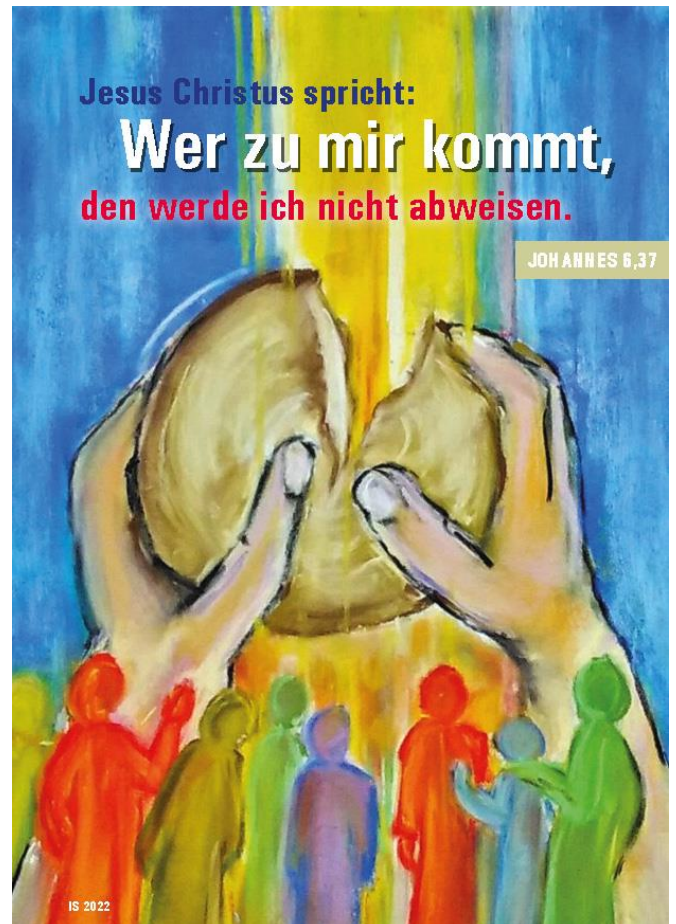
Gedanken und Gestaltung zur Jahreslosung (I. Schaar, Bereichsleitung 5/6)

bei allen Eltern und Elternvertretern/-innen, die sich für die zukünftigen Eltern während der diesjährigen Termine des Schulspiels der neuen Erstklässler Zeit genommen und diese bewirten haben.