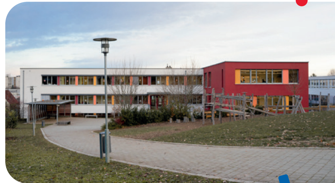
Schulgebäude in Laisen

Je nach Stundenplan können im Bereich 5/6 einzelne Fachunterrichte (i.d.R. Randstunden oder nachmittags) auch im Gebäude Königstraße stattfinden. Der Sportunterricht findet immer im Königstraße statt. Ab Klasse 7 ist der Unterricht für alle Klassen im Königstraße. In der Mittagspause können die Schüler unsere Mensa besuchen.