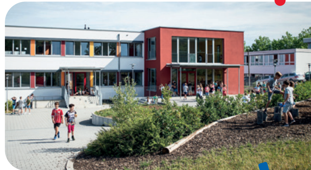
Schulgebäude in Laisen

Je nach Stundenplan können im Bereich 5/6 einzelne Fachunterrichte (i.d.R. Randstunden oder nachmittags) auch im Gebäude Königsträße stattfinden. Der Sportunterricht findet immer im Königsträße statt. Ab Klasse 7 ist der Unterricht für alle Klassen im Königsträße. In der Mittagspause können die Schüler unsere Mensa besuchen.