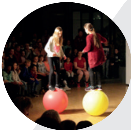
Abend für Freunde und Eltern

Die genannten Inhalte und Ausführungen beschreiben den Stand des Schuljahres 2020/2021. Wir behalten uns vor, in Zukunft einzelne Inhalte gegebenenfalls abzuändern (z.B. auf Grund von Bildungsplanänderungen, Veränderungen von Schülerzahlen oder Änderungen durch neue Erfahrungswerte).