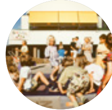
Erweiterung Grundschule → 1990