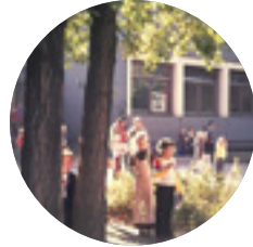
FES im Bea-Haus → 1974