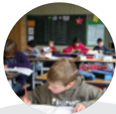
Gründung Realschule → 2009