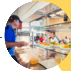
Start Mensabetrieb → 2006