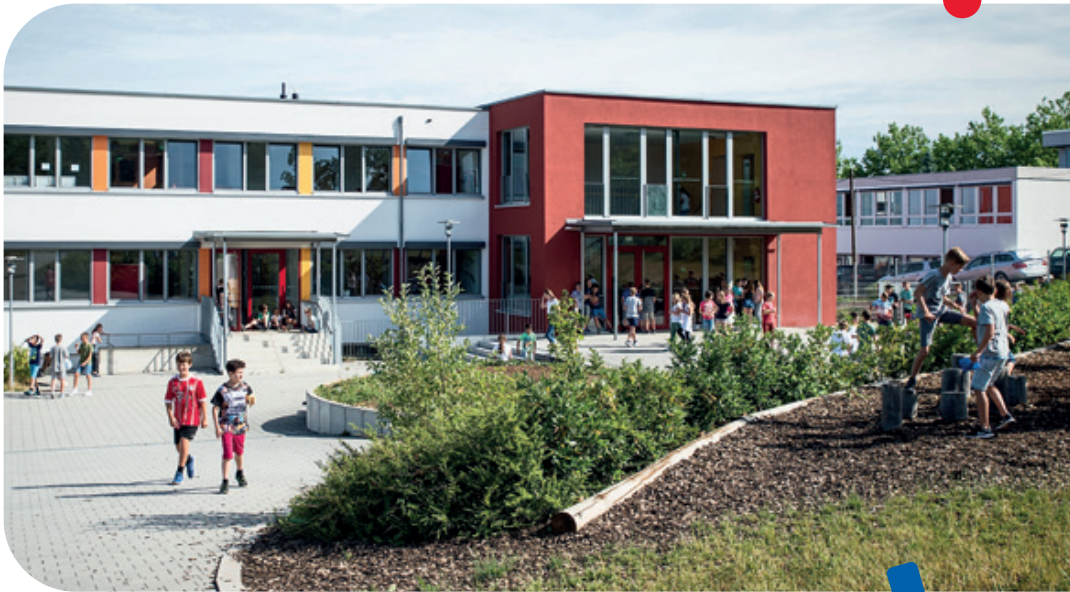
Schulgebäude in Laisen

Je nach Stundenplan können im Bereich 5/6 einzelne Fachunterrichte (i.d.R. Randstunden oder nachmittags) auch im Gebäude Königsträßle stattfinden. Der Sportunterricht findet immer im Königsträßle statt. Ab Klasse 7 findet der Unterricht für alle Klassen im Königsträßle statt. In der Mittagspause können die Schüler unsere Mensa besuchen.