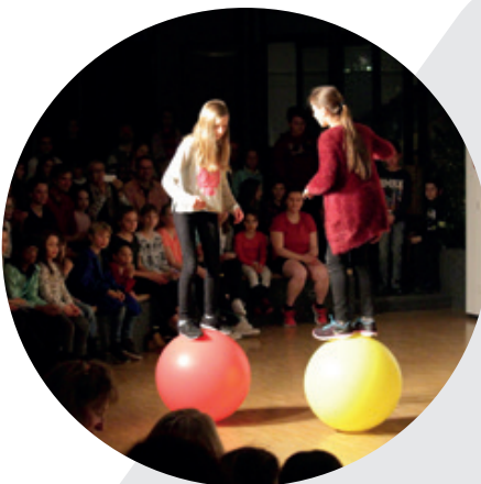
Abend für Freunde und Eltern

Die genannten Inhalte und Ausführungen beschreiben den Stand des Schuljahres 2019/2020. Wir behalten uns vor, in Zukunft einzelne Inhalte gegebenenfalls abzuändern (z.B. auf Grund von Bildungsplanänderungen, Veränderungen von Schülerzahlen oder Änderungen durch neue Erfahrungswerte).